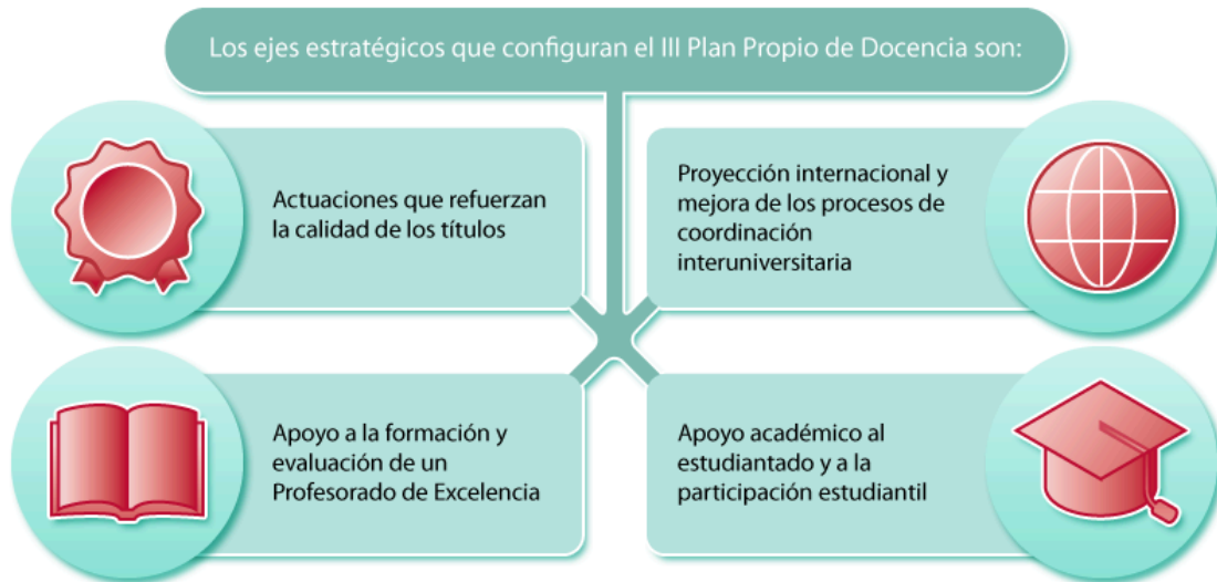
Líneas estratégicas del Tercer Plan Propio de Docencia (2017-2020)

En este marco, resulta clave la elaboración de este Plan de Participación Estudiantil que redunde en la formación integral de nuestro estudiantado para el ejercicio de una ciudadanía responsable y que recoja actuaciones para promover la participación activa de los estudiantes en los diferentes aspectos que abarca la vida universitaria (formación, gestión, investigación, cultura, etc.). El Plan de Participación Estudiantil debe contemplar acciones y actividades dirigidas a fomentar la participación de los estudiantes de la Universidad de Sevilla en la vida universitaria más allá del ámbito estrictamente académico, que redunden en su formación integral como complemento a los conocimientos, capacidades y habilidades adquiridos a través de sus titulaciones.