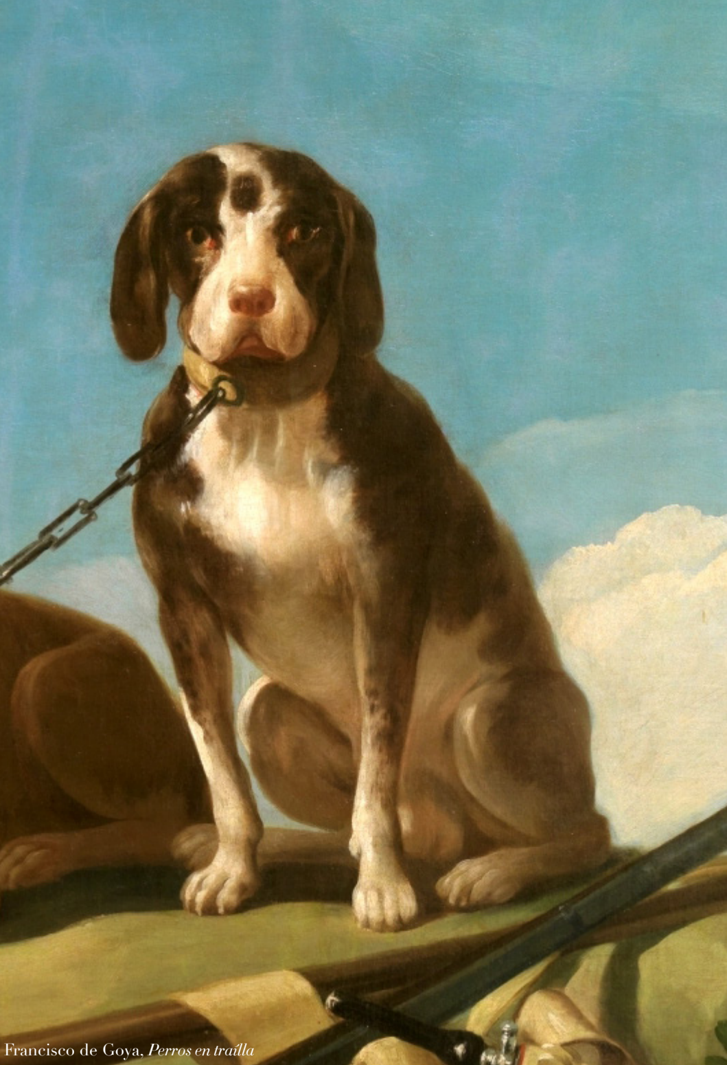
Francisco de Goya, Perros en tralla